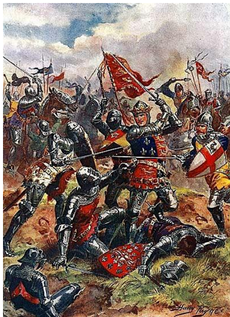
Slika 1. Scena iz Bitke kod Agincourta

Padom Zapadnog Rimskog Carstva vojna tehnologija i profesionalne vojske (vojske koje se sastoje od vojnika kojima je to posao, koji su trenirani za rat) poprilično su zapostavljene. Borbe su se često vodile među nagomilanim, loše discipliniranim hordama u kojima su se isticali samo hrabriji pojedinci (Jorgensen 2014: 9). Bizantsko Carstvo i Normani jedini su uspjeli održati tradiciju profesionalnog vojnika, što se Bizantu pokazalo korisnim u 6. stoljeću kada su, koristeći takvu dobro uvježbanu i organiziranu vojsku, skoro uspjeli obnoviti staro Rimsko Carstvo, dok je Normanima takva vojska dobro došla u 11. stoljeću u uspješnoj invaziji na Englesku. Kasnije, od 14. stoljeća, profesionalne i dobro organizirane vojske ponovno su zavladaile bojištima te se pokazalo da mogu pobijediti i brojčano puno nadmoćniju vojsku, tj. pokazalo se da je dobra taktika važnija od samog broja vojnika (Jorgensen 2014: 91). Idealni primjer za to je Bitka kod Agincourta u Francuskoj (jedna od bitki Stogodišnjeg rata) koja se odvila 1415. godine i u kojoj je malena vojska Henrika V. od 6000 vojnika, zahvaljujući dobroj disciplini i masovnoj paljbi strijelaca, pobijedila veliku francusku vojsku od 36 000 vojnika.