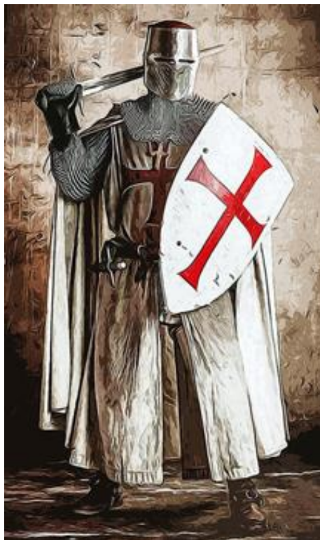
Slika 18. Templar

Templari su osnovani 1119. godine s ciljem da pomognu novostvorenom Jeruzalemskom kraljevstvu da se odupre napadima muslimana iz okolice i pruže sigurnost velikom broju hodočasnika koji su krenuli u Jeruzalem nakon njegovog osvajanja. Članovi su se dijelili na vitezove, svećenike i braću pomoćnike (pješačija, bankari, oružari, kovači, konjušari, kuhari, pivari, kožari, inženjeri, zidari, arhitekti, liječnici), a na čelu reda bio je veliki meštar. Nosili su bijelu odjeću s crvenim križem na ramenu, a oružja su im bila mač, koplje, malj, te okrugli štit ili trokutasti štit. 13 Red je 1312. ukinuo papa Klement V. pod utjecajem francuskog kralja Filipa IV. (jer ga je smetalo što su templari imali velike posjede u Francuskoj).