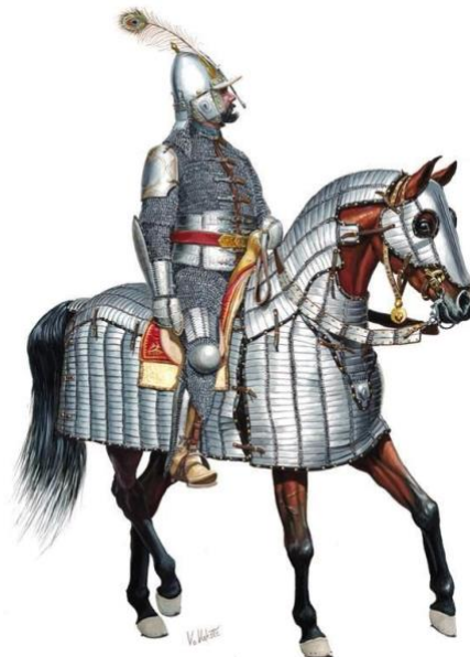
Slika 11. Spahija