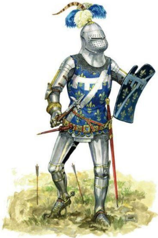
Slika 15. Francuski vitez

Tipičan francuski vitez srednjeg vijeka nosio je čvrsti puni oklop izrađen od jednog komada željeza, kacigu s vizirom, a preko svega heraldičku odoru 11 . Bio je naoružan mačem i pravokutnim štitom ili dugim kopljem i trokutastim štitom (Jorgensen 2014: 93). Poznato je i da je Francuska imala jedne od najbolje istreniranih i obučanih mušketira u Europi te mušketire-konjanike koji su koristili lakšu vrstu muškete koja je bila ovješena o sedlo.