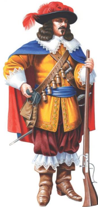
Slika 16. Mušketir