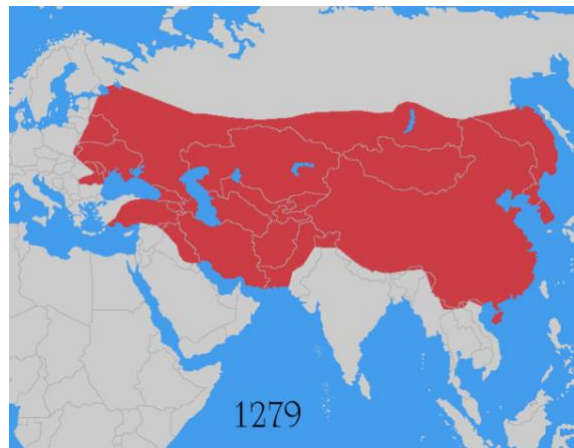
Slika 9. Mongolsko Carstvo na vrhuncu ekspanzije