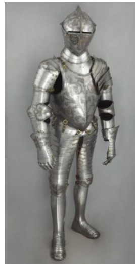
Slika 3. Puni oklop