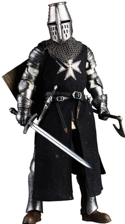
Slika 19. Ivanovac

Ivanovci su osnovani još 1070. kao Red Bolnice sv. Ivana, a vojni red postali su oko 1148. kada je zabilježen prvi vitez reda. Redom su upravljali meštar i maršal, a članovi reda su novačeni iz redova kršćanskih vojnika i preobraćenih Arapa (Jorgensen 2014: 79). Odjeća im je bila oklop ili redovnička halja, a preko nje crni plašt s bijelim križem na leđima. Borili su se kao vitezovi, teško naoružani pješaci, samostrijelci ili laki konjanici. Djeluju i danas pod nazivom Suvereni malteški viteški red hospitalaca sv. Ivana Jeruzalemskog i crkveno su priznati red (Birlin, Šarlija i Magaš 2019: 40). Naš grad Ivanec, koji je bio jedno od sjedišta reda, nosi ime po vitezovima ivanovcima.