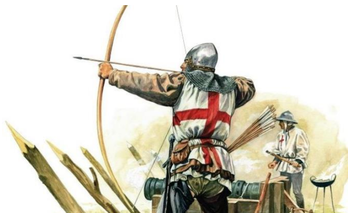
Slika 6. Engleski strijelac napinje dugi luk

Glavna specifičnost engleske vojske u srednjem vijeku bilo je izvrsno znanje korištenja dugog luka, koji se naziva još i engleski dugi luk. Iako su i vojske drugih zemalja koristile to oružje, ni jedna nije uspjela s tolikim uspjehom kao Engleska. Najviše se dokazao u Stogodišnjem ratu kada su u mnogo borbi strijelci njime naoružani zadali velike gubitke francuskoj vojsci. Iako ni samostrel ni dugi luk nisu imali očitu prednost jedan nad drugim (samostrel je imao veći domet, a dugi luk veću brzinu odapinjanja i jeftiniju i kraću izradu), očito je da je dugi luk bio smrtonosan ako su ga koristili dobro uvježbani strijelci poput engleskih (Byam 1990: 18). Druga posebnost engleske vojske je korištenje lakih i slabo oklopljenih vojnih skupina koje bi išle, pješice ili na konjima, ispred glavnine vojske te bi odlazile u izvidnicu, mamile protivničku vojsku ili izvršavale manje napade. 3 Takvu taktiku Englezi su također najviše koristili u Stogodišnjem ratu. Engleska je također koristila i ranu verziju topa, koja je ispucavala kamene kugle i koju su najčešće postavljali u luke da čuvaju zaljeve i morske prolaze. Poznata je i vladareva tjelesna straža – saski huskarli koji su se engleskim vladarima zaklinjali na vjernost i bili su naoružani sjekirom s dugim drškom i štitom u obliku naopake kapljice vode (Jorgensen 2014: 71).