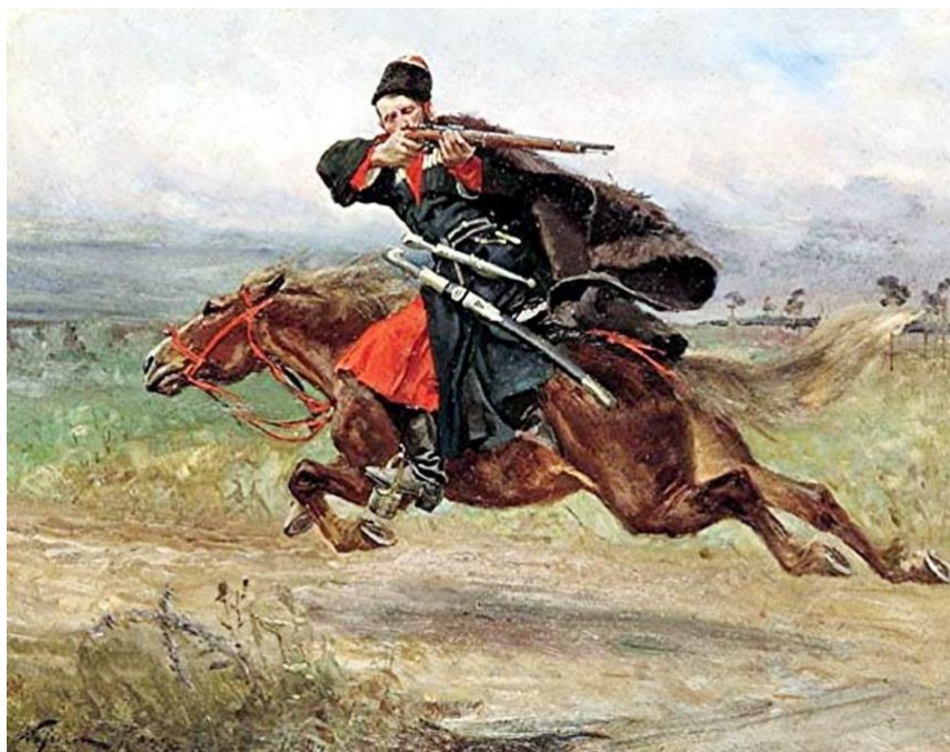
Slika 14. Kozak u borbi

Iako je ujedinjena ruska država kao takva nastala tek početkom novog vijeka (1547.), pa tako prije nije ni imala zajedničku vojsku, na tom je prostoru već stoljećima bilo puno malih kneževina, a glavnu vojnu silu na tim prostorima predstavljali su kozaci . Bjegunci od feudalne tlake, neustrašivi i surovi ratnici, bili su jedni od najboljih lakih konjanika svog vremena. 10 U borbi ih je odlikovala hrabrost, no često su se borili „svatko za sebe“, a ne kao skupina. Vodili su mnogo bitaka tijekom 16. i 17. stoljeća protiv Mongola, Osmanlija, Poljaka i puno drugih naroda i država te postali poznati po svojoj okrutnosti. Iako su ratovali i protiv Rusa, Rusi su ih od 17. stoljeća sve više novačili u svoje redove te su do 2. svjetskog rata kozaci sudjelovali u gotovo svakoj važnijoj bitci Ruskog Carstva i SSSR-a pa se tako mogu smatrati ruskom vojskom.