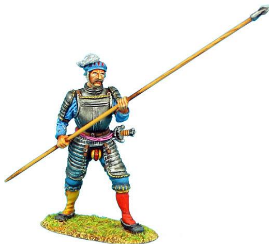
Slika 7. Landsknecht naoružan dugim kopljem

Landsknechti su se borili vrlo zbijeni, kao što je to nekad radila falanga Aleksandra Velikog i takvim načinom borbe jedno su vrijeme činili vojsku koju je bilo vrlo teško svladati. Duljina koplja se s vremenom povećavala te je u doba kasnog srednjeg vijeka iznosila čak i više od šest i pol metara.