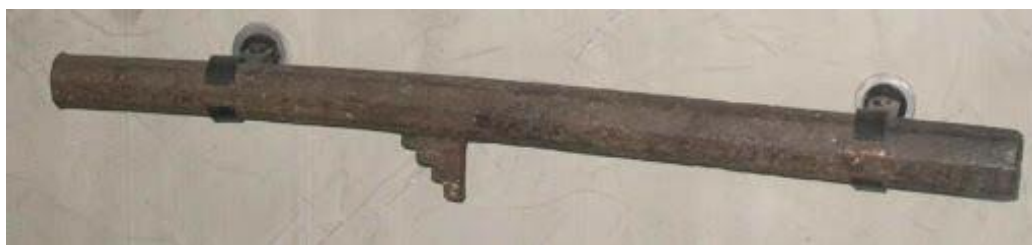
Slika 17. Puška kukača