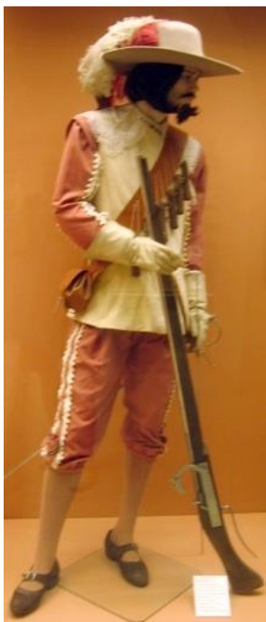
Slika 12. Španjolski arkebužir

Za osvajanja i ratovanje izvan Europe, Španjolska je koristila konkvistadore, vojnike-istraživače koji su od 15. do 18. stoljeća gradili kolonijalno carstvo Španjolske. Bili su naoružani mačem ili sabljom, imali ili puni prsni oklop ili nikakav oklop te nosili prepoznatljive morion kacige. Konkvistadori su većinom bili bivši laki konjanici te su s modernim europskim oružjem i taktikama lako svladavali domoroce (nad kojima su vršili strahovito nasilje) koji nisu poznavali napredna oružja, a i nisu bili spremni na napade. 9