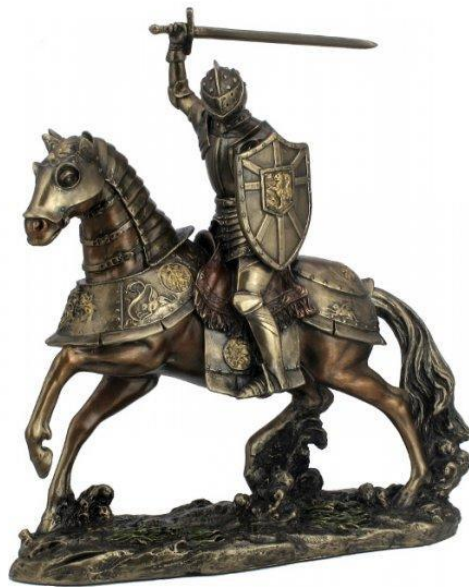
Slika 5. Vitez na konju