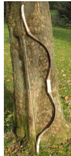
Slika 4. Kompozitni luk