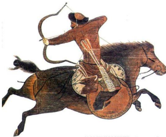
Slika 8. Keshig u borbi

Efikasnost mongolske vojske uopće nije u pitanju jer se zna da je Mongolsko Carstvo bilo jedno od najvećih u povijesti, a ovaj njihov način borbe koji sam opisao bio je idealan s obzirom na veličinu teritorija koji je trebalo osvojiti, na njihovu filozofiju i na kraju krajeva, na resurse i tehnologiju koje su imali i poznavali.