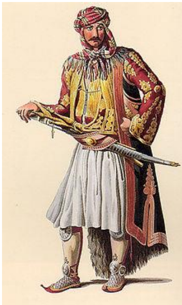
Slika 10. Janjičar

Kao prethodnica osmanske vojske kretali su se odredi akindžija, lakih konjanika koji nisu dobivali plaću, nego su živjeli isključivo od pljačke (Birlin, Šarlija i Magaš 2019: 213).