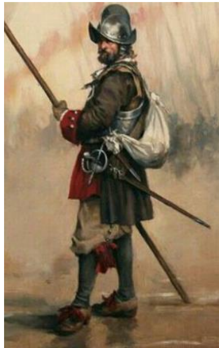
Slika 13. Konkvistador